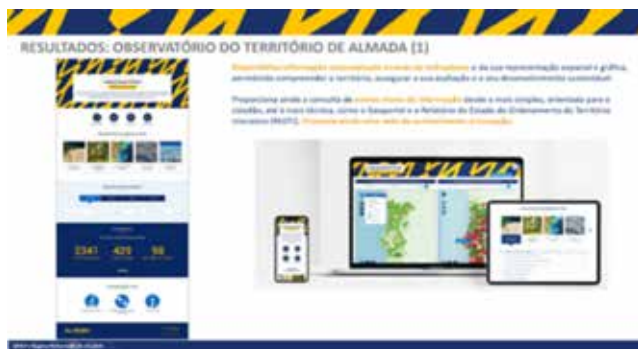
Figura 7. «Observatório do Território de Almada»

O resultado pretendido será obter uma ferramenta com informação coesa e credível, suportada na «Infraestrutura de Dados Espaciais de Almada» (IDEA) e nas várias bases de dados/sistemas dispersos pelos vários serviços (Figura 9), que possa ser utilizada internamente e nas operações diárias pelos serviços, pelos decisores e responsáveis estratégicos e operacionais, e também pelas empresas, universidades e cidadãos.