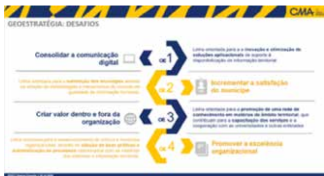
Figura 2. Planeamento da implementação da «Geoestratégia»

Também em 2020, decorrentes da ausência de sistemas holísticos e integrados, não permitindo o envolvendo todos os atores com intervenção no território e uma gestão do território integrada, foi lançado o «Geoportal». Atualmente estão a ser realizadas provas de conceito no âmbito do «Geoportal», para a configuração de áreas de trabalho