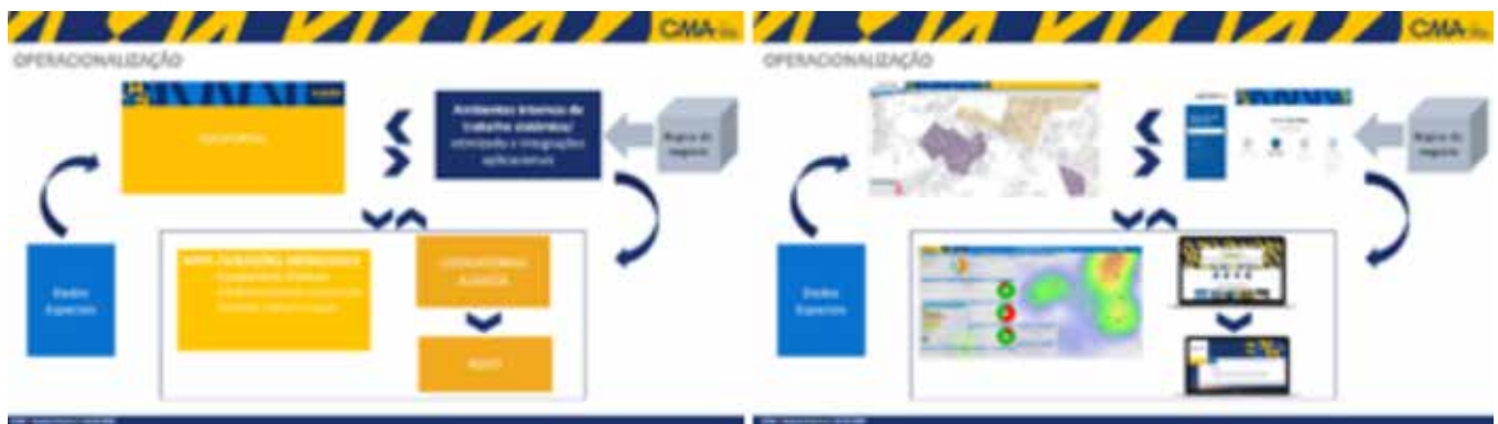
Figura 3. Operacionalização «Geoestratégia».

No âmbito dos trabalhos que integram a 2ª fase do Geoportal, foram já realizadas provas de conceito (protótipos),