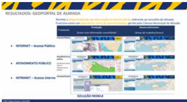
Figura 5. Visão dos módulos que integram o «Geoportál de Almada»

Sendo o «Geoportál» uma solução de utilização não generalizada pelos munícipes, optou-se por lançar outras soluções suportadas em plataforma e aplicações móveis – como as plataformas «Equipamentos públicos»; «Turismo, cultura e lazer»