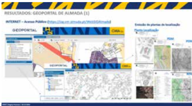
Figura 4. «Geoportál de Almada»

de acordo com as áreas da atuação dos serviços: