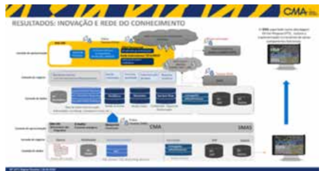
Figura 9. «Infraestrutura de Dados Espaciais de Almada (IDEA)»