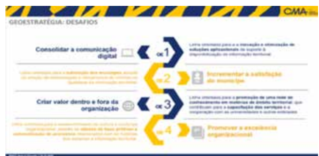
Figura 1. «Geoestratégia» e os principais desafios