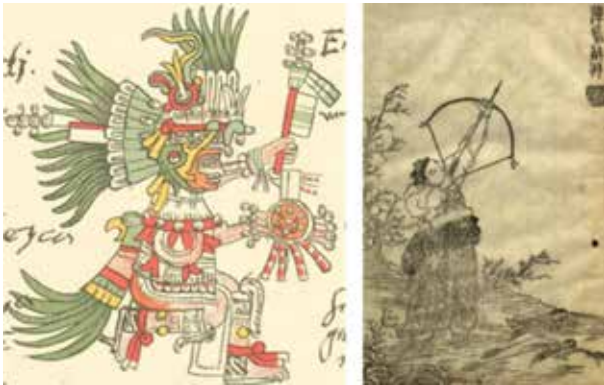
Huitzilopochtli, en el Códice Telleriano-Remensis (Méjico. S. XVI). El arquero en la obra Petición de los Cielos (1645)

se supo nada hasta nuestros días, gracias al imparable desarrollo de la era espacial y al creciente lanzamiento de sondas que han ido explorando su sistema y a él mismo. Se comprende así que hayan proliferado toda clase de mitos y leyendas, algunas de las cuales han perdurado durante milenios y aún se mantienen en el acervo popular. Lo más sobresaliente, en ese aspecto, ha sido el haber llegado a considerarlo Dios en la mayoría de las civilizaciones 11 . De los muchos ejemplos que podrían traerse a colación, nos ha