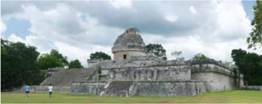
El Observatorio del Caracol, en Chichén Itzá, y parece que fue ultimado en el año 906. Fue llamado así por los conquistadores españoles, en atención a la escalera del interior de la torre cilíndrica remata por una cúpula sensiblemente esférica.

el año 2500 a. C. aunque Cassini dudase de su verosimilitud, el también jesuita A. Kircher demostró que realmente acaeció en el año 2449. Cita también Bailly que bajo el reino de Hoang-ti, en el 2697 a. C., uno de sus ministros, llamado Yu-chi, descubrió la estrella polar y construyó un globo celeste. Se cree igualmente que Fohi fue el primer emperador que estuvo verdaderamente interesado en la astronomía, allá por el año 2952 a. C., llegó a estudiar el movimiento de las estrellas y a reflejarlo en unas tablas astronómicas construidas a tal efecto. Bailly aseguraba en este resumen que la esfera celeste fue inventada por los astrónomos chinos.