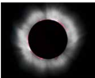
Observar la corona solar iluminada por la luna