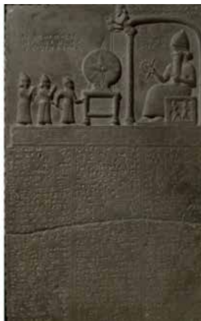
Nicho con el Dios Ra en el templo de Abu Simbel, al Sur de Egipto. En la estela de la derecha aparece el Dios Shmash sentado, bajo la luna y las estrellas, delante de él sobresale la imagen de un disco solar apoyado en un altar y suspendido por otra deidad.