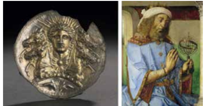
Bella alegoría del orto solar, con la carroza de Apolo apareciendo sobre el horizonte. Junto a ella se presenta un grabado holandés de Tolomeo con la esfera armilar.

ella se comenta por ejemplo que, aunque no conocieran la estrella polar, podían materializar la dirección norte sur siguiendo procedimientos gnomónicos. Otra buena muestra de sus conocimientos astronómicos era el hecho de saber la época del año en que se encontraban, a través de la posición del orto solar sobre su horizonte sensible. Se le atribuyen también los clásicos calendarios en espiral, sobre la que llegaba a proyectarse la luz solar, a través de ranuras abiertas en la roca circundante, en las épocas más señaladas del año. Son numerosos los pictogramas que se conservan y que están repartidos por sus zonas de influencia, llegaron a representar en uno de ellos (Cañón del Chaco) la supernova del cangrejo, visible el 4 de julio del año 1054, aunque algunos asegurasen que se trata del planeta Venus. Mención especial merece la llamada Casa Rinconada, una construcción circular en lo alto de una colina, que parece representar el modelo cosmológico de los Anasazi o bien un observatorio solar, en base a los nichos que contiene a la posición de una alineación sensiblemente coincidente con la meridiana.