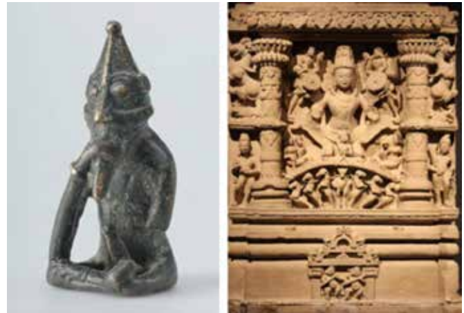
Estatuilla de Rällinge (Södermanland, Suecia), se cree que representa a Frey y data de la época vikinga. Imagen de Suria montando la carroza tirada por siete caballos, solía llevar siempre una flor de loto.

Los indígenas Fon de Benín y los Ewé, que habitan en Ghana, Benín y Togo, creen que Lisa (Dios del Sol) y Mawu (el Dios de la Luna) tiene espíritus gemelos. Para ellos, los dos juntos son los creadores del universo, Representando Mawu la maternidad y la fertilidad mientras que Lisa es la encarnación de la energía, el trabajo y la fuerza. En la religión cristiana se observan prácticas parecidas a las que han sido mencionadas hasta aquí. En efecto, la fecha del propio nacimiento de Jesucristo parece que fue forzada para que no coincidiese exactamente con el solsticio de invierno. La proliferación de imágenes en los que se representa al creador o al salvador con corona es signo evidente de la influencia solar, más clara es todavía en las famosas custodias, saliendo de la sagrada forma haces de rayos como si fuese el mismo Sol. El paralelismo entre los doce apóstoles, los doce meses del año y los doce signos del zodiaco tampoco ofrece