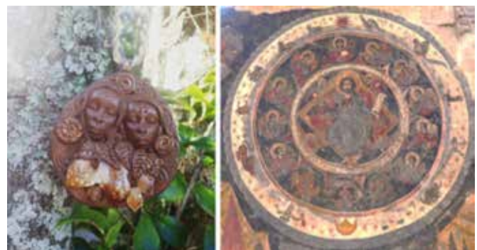
Una representación moderna de las deidades Mawu y Lisa. A la derecha fresco de Jesús en el centro del zodiaco. Catedral Svetitskhoveli en Mtskheta (Georgia).