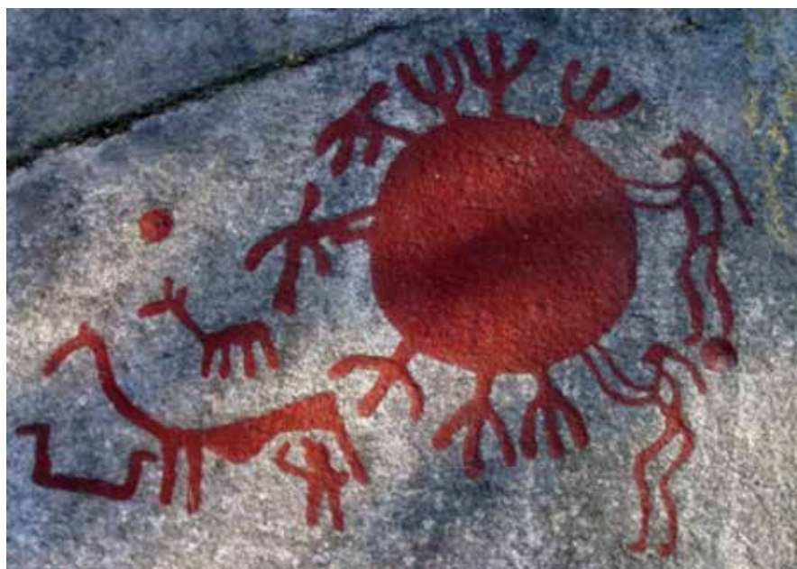
Petroglifo escandinavo con el Sol, rodeado de adoradores. Dos de las figuras femeninas tocan el disco. Museo Underslöss & Universidad de Gothenburg

Ese aspecto mutable del firmamento les debió de resultar incomprensible, máxime cuando, para un lugar y hora dados, no se veían las mismas estrellas si el intervalo de tiempo transcurrido entre dos observaciones consecutivas era considerable. Tampoco alcanzarían a comprender en un principio cómo el Sol era diferente al resto de las estrellas, en tanto que presentaba una particularidad muy llamativa: el hecho de que su máxima altura sobre el horizonte variase de un día a otro, aunque todos los valores de la misma estuviesen comprendidos entre las cifras extremas que alcanzaba en los dos solsticios y su valor medio se produjera en los equinoccios. En otras palabras, colegirían que en el periodo analizado había una clara separación: durante la primera mitad, la duración de los días era mayor que la de las noches, justo lo contrario de lo que ocurría en la otra mitad; en la frontera de las dos mitades la duración del día coincidía con la de la noche. Mucho más adelante se admitiría que tales hechos eran una prueba evidente de que el Sol estaba animado por otro movimiento complementario del diurno,