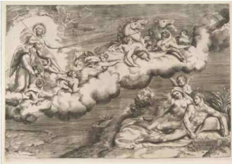
Alegoría del Sol naciente. Se representa como un hombre desnudo que conduce cuatro caballos, símbolo de sus desplazamientos por la bóveda celeste, y es acompañado por el padre tiempo. El astro aparece rodeado por una corona circular que representa a la banda zodiacal. El autor del grabado fue el italiano Giulio Bonasone, en torno al año 1530.

desplazándose sobre un plano oblicuo con relación al ecuador y que forma con él un ángulo próximo a los 23^{\circ} 26' , un valor conocido como oblicuidad de la eclíptica 3 .