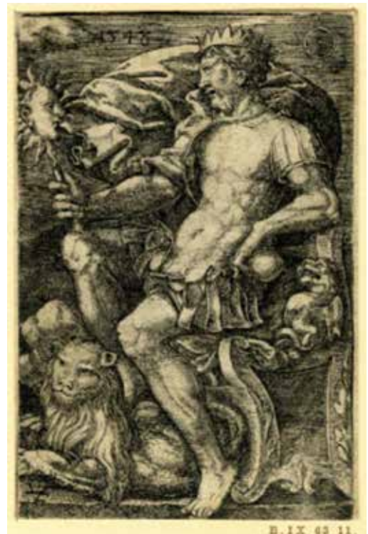
El Sol como rey. En el brazo derecho lleva el cetro con su figura y en el izquierdo el orbe. El león acrecienta la supremacía sobre los demás planetas. Grabado de 1548, por Hans von Lademspelder. Serie de los planetas.