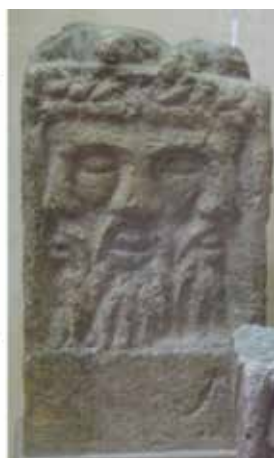
Eclipse total de Sol ocurrido el 20 de marzo de 2015, siendo visible desde las regiones polares del hemisferio norte. La imagen de la derecha es la advocación tricéfala del Dios Lug, fue descubierta en Reims.

parecido representativa la selección que se resume a continuación.