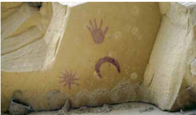
Pictograma con la luna creciente y la supuesta supernova SN 1054, la cual se mantuvo visible durante 22 meses. Cañón del Chaco en Nuevo Méjico.

Las alineaciones con el Sol jugaron un papel muy destacado en las ciudades mayas, de modo que los edificios ceremoniales se diseñaron de acuerdo con las direcciones cardinales. Los observatorios astronómicos presentaban la particularidad de que durante los equinoccios de primavera y de otoño los rayos solares penetraban por las troneras